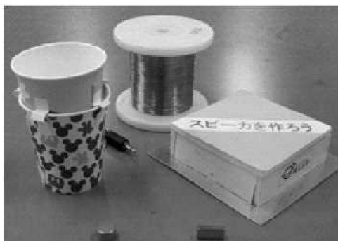
fig.1 紙コップスピーカ

紙コップを主材料としてスピーカの製作と、紙コップスピーカよりも高性能な平面型スピーカの製作を行う(fig.1)。