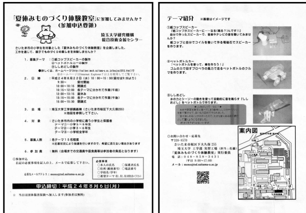
fig.3 参加要項のチラシ

(fig.3)をさいたま市教育委員会を通じ7月に配布した。併せて、さいたま市内の児童センター及び図書館、桜区役所へ直接赴き、ポスターの掲示とチラシの設置を依頼した。また、同時に専用サイトを立ち上げ、参加申込はメールでの受付とした。